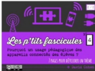
4/ BYOD 2/2