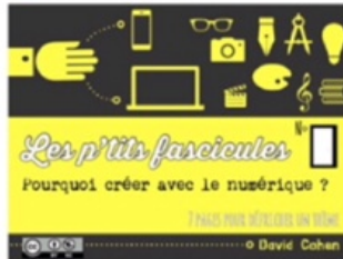
5/ créer avec le numérique