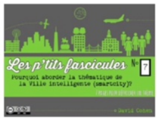
7/ Smart city maker

! DÉJÀ 9 OPUS 7 NUMÉROS + 2 HORS-SÉRIE MERCI DE VOTRE SOUTIEN 🙏