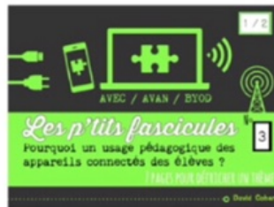
3/ BYOD 1/2