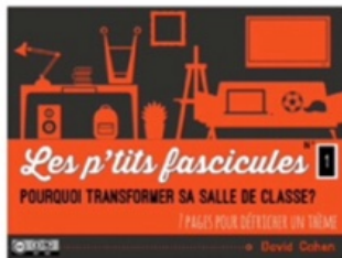
1/ espaces scolaires