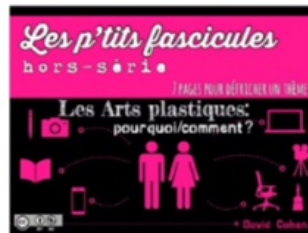
2/ Arts plastiques