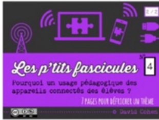
4/ BYOD 2/2