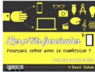
5/ créer avec le numérique