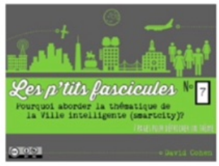
7/ Smart city maker

! DÉJÀ 9 OPUS 7 NUMÉROS + 2 HORS-SÉRIE MERCİ DE VOTRE SOUTIEN 🙏