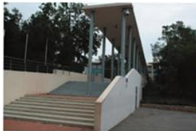
Vue de la passerelle d'entrée qui fait le lien entre l'extérieur et l'intérieur du collège.