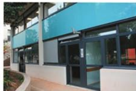
Vue de la façade Ouest, avec les portes d'accès extérieur aux classes.