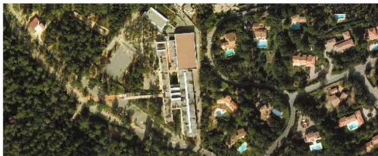
Vue aérienne du collège Niki de Saint Phalle et son contexte

Extrait d'une étude de cas, thèse de S. Allaire, Ecole Luminy, Marseille. Le confort méditerranéen