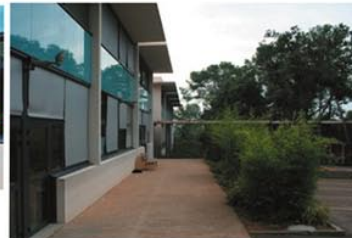
Vue de la façade Ouest du collège