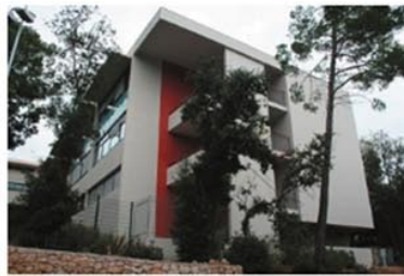
Vue de l'angle Sud-Ouest du bâtiment.