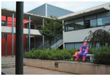
Vue du patio qui sépare les deux bâtiments et vue de la seconde façade Ouest. Le patio abrite une sculpture de Niki de Saint Phalle, artiste Niçois.