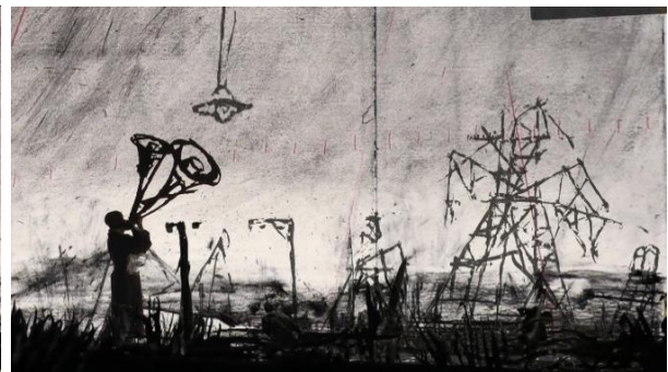
William KENTRIDGE, More Sweetly Play the Dance (Jouer la danse plus doucement) , 2015, dimensions variables, installation vidéo 8 canaux haute définition, 15 min, avec 4 porte-voix. Musée des beaux-arts du Canada, Ottawa, Canada.