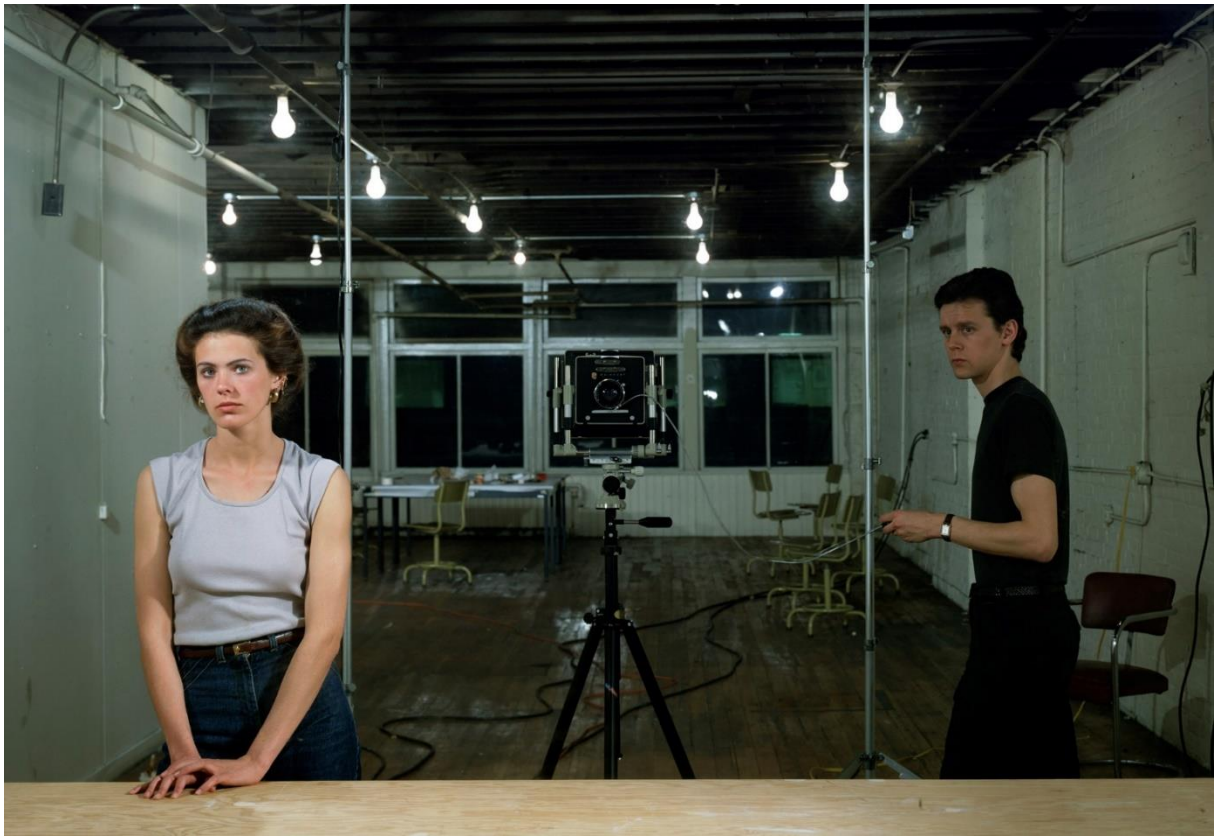
Jeff WALL, Picture for women (Image pour les femmes) , 1979, 2 épreuves cibachrome jointes bord à bord, caisson lumineux, 161 x 223 cm, épaisseur : 28 cm. Musée national d'Art moderne, Paris, France.