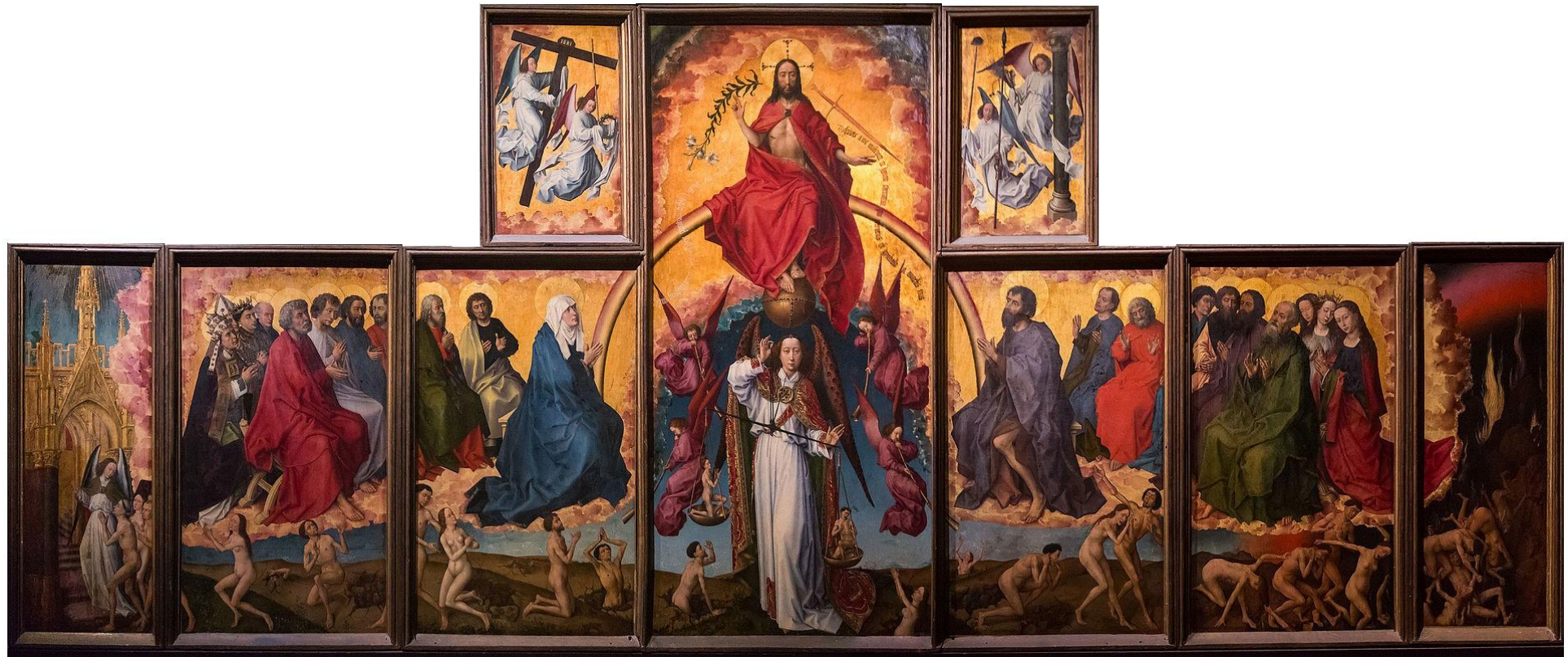
Rogier VAN DER WEYDEN, Le Jugement dernier , 1443-1452, retable polyptyque recto-verso, huile sur bois, 2,20 x 5,48 m. Hospices de Beaune, Beaune, France.