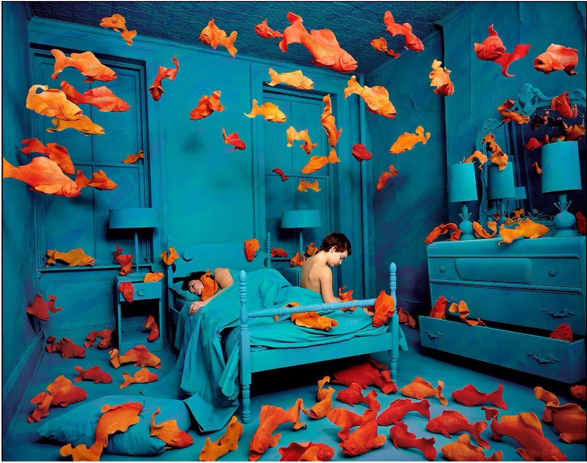
Sandy SKOGLUND, Revenge of the Goldfish (La revanche des poissons rouges) , 1981. Photographie couleur, tirage Cibachrome, 65 x 83 cm. Collection du FRAC Lorraine, Metz, France.

L'espace de la pièce a été entièrement peint ; Sandy Skoglund a réalisé les poissons en terre cuite, qu'elle a ensuite disposés dans l'installation pour en faire la photographie.