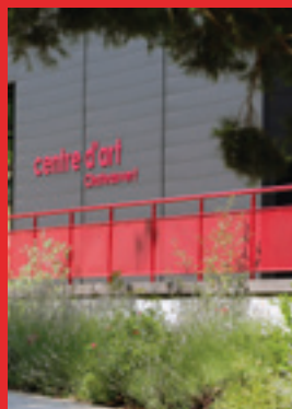
Le Centre d'Art de Châteauvert

3 autres lieux sont à votre disposition à moins de 30km de Tourves