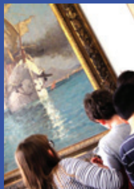
Le Musée des Comtes de Provence

Chemin de la Réparade 83670 Châteauvert 07 81 02 04 66 cacc@caprovenceverte.fr