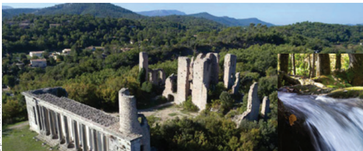
Le Château de Valbelle - 5min