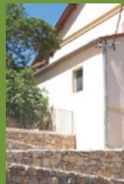
Le Centre d'Art de Sainte Anastasie sur Issole

Place des Comtes de Provence 83170 Brignoles 04 94 86 16 04 mcp@caprovenceverte.fr