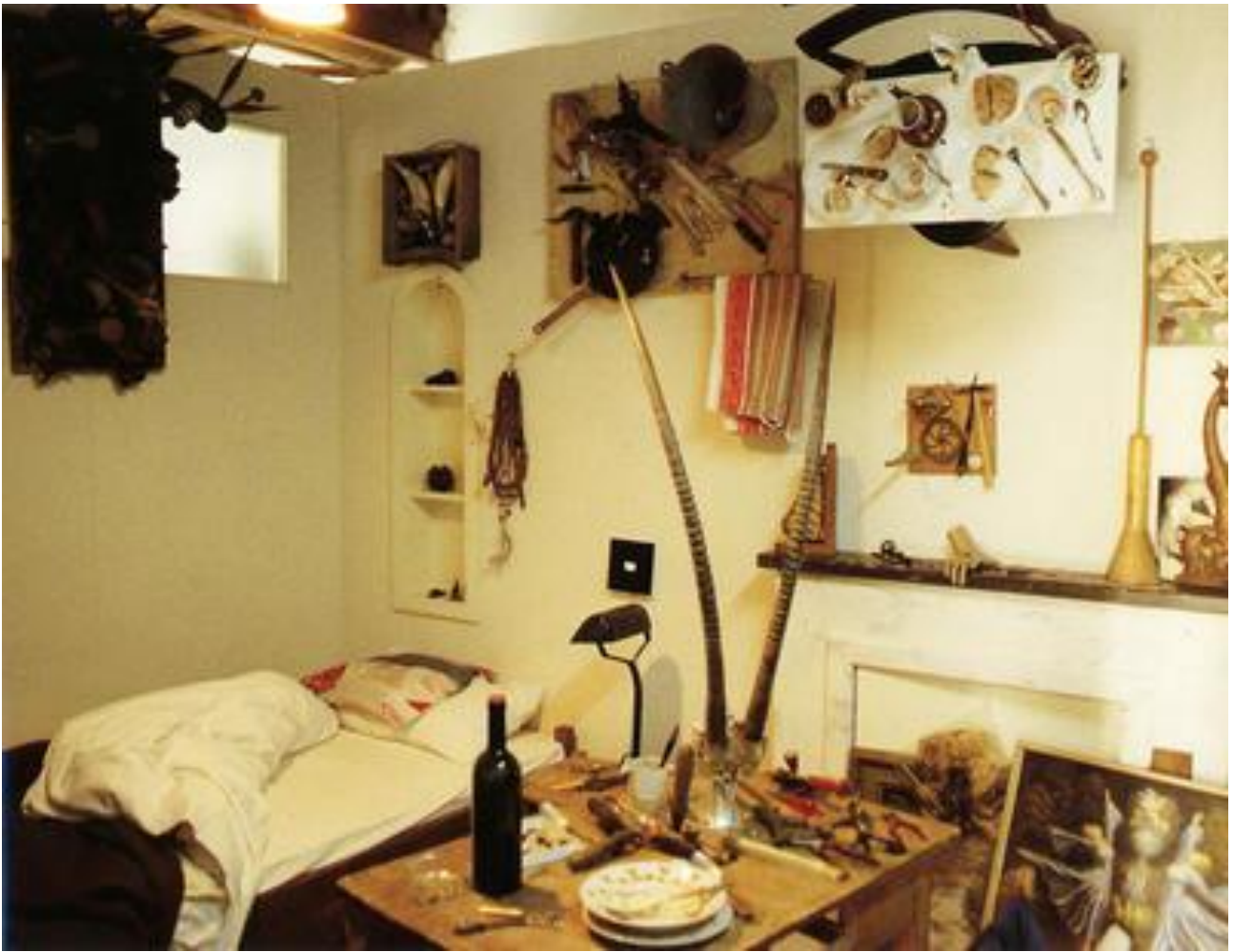
Réplique de la Chambre 13 de l'Hôtel Carcassonne (24 rue Mouffetard), Paris, 1998

Assemblage de mobiliers, vaisselles et œuvres (53)