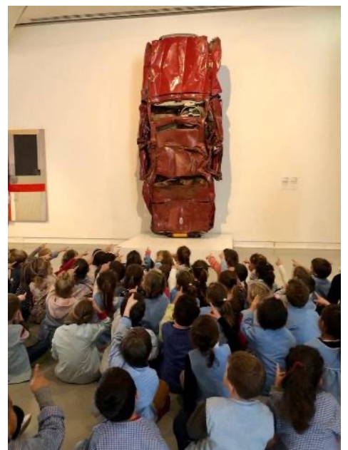
Projet « La classe, l'œuvre » avec la classe de GS maternelle de l'école Terra Amata.