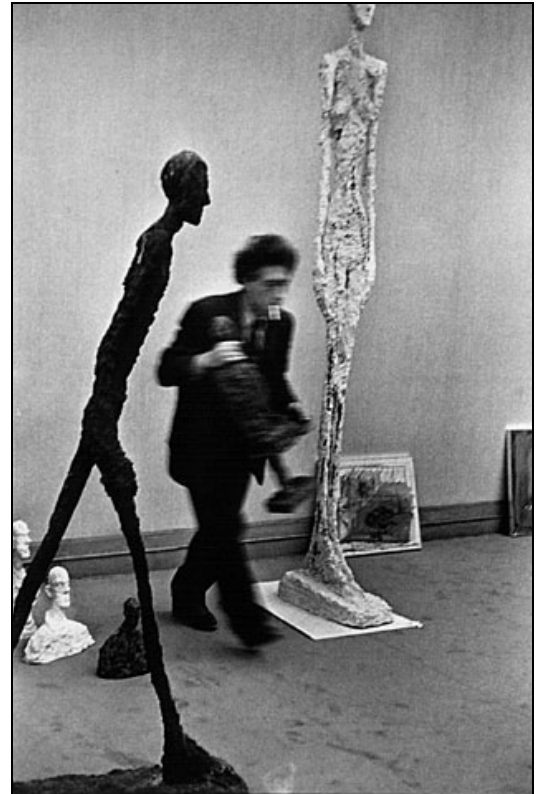
Giacometti dans son atelier