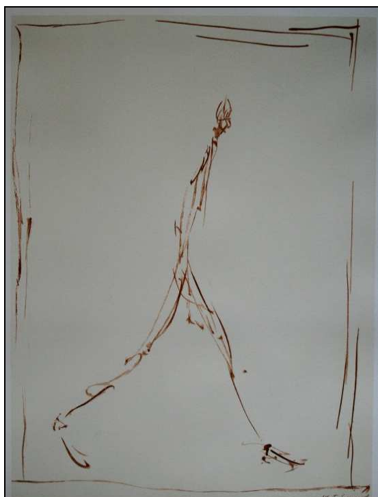
Alberto Giacometti L'homme qui marche