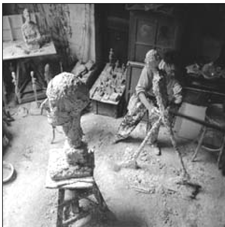
Alberto Giacometti réalisant une épreuve en plâtre