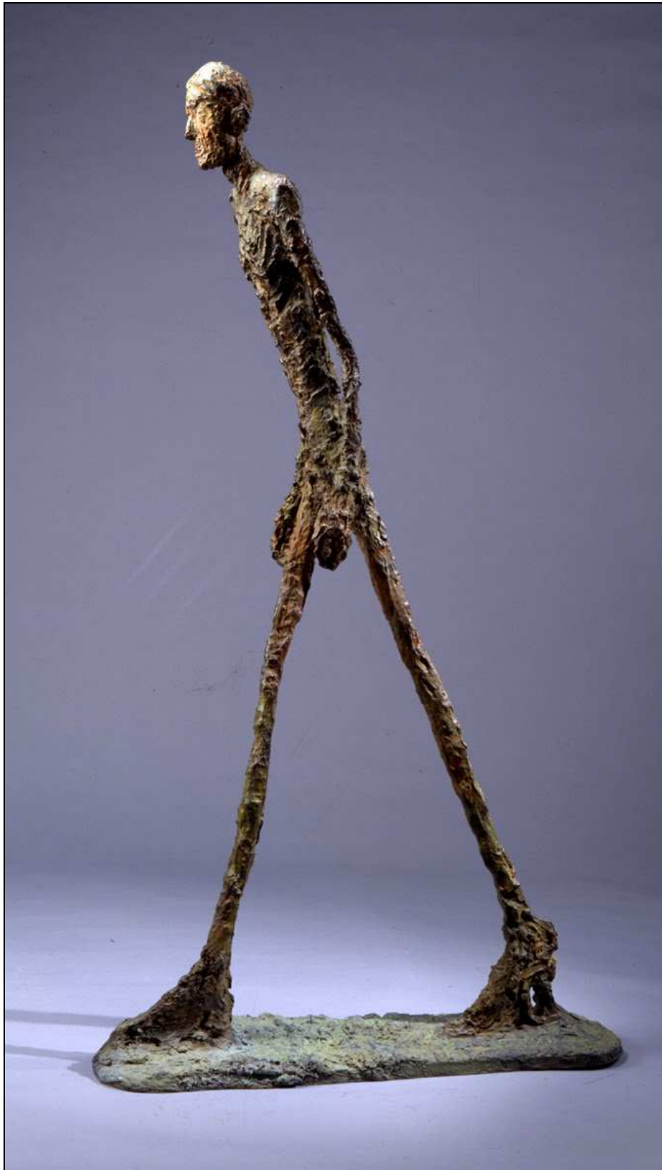
Alberto GIACOMETTI / L'homme qui marche / 1960 / Bronze (1805 X 97 X 23.9 cm)