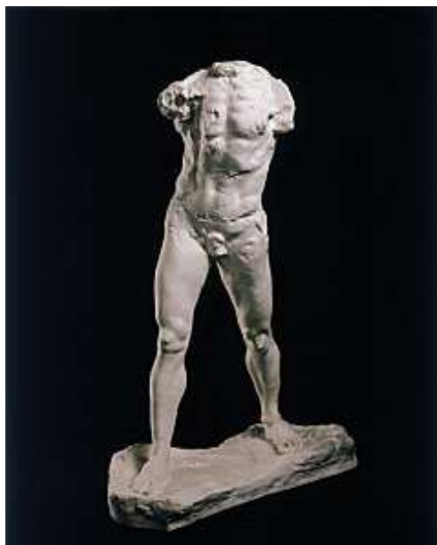
Auguste Rodin L'homme qui marche