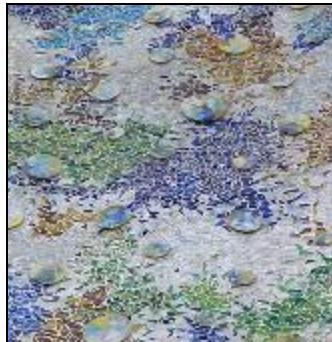
Antonio Gaudi Casa Batlló