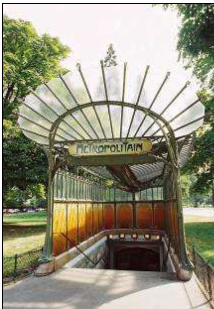
Hector Guimard Bouche de métro

Art Nouveau : Victor Horta, Hector Guimard, Louis Majorelle, René Lalique