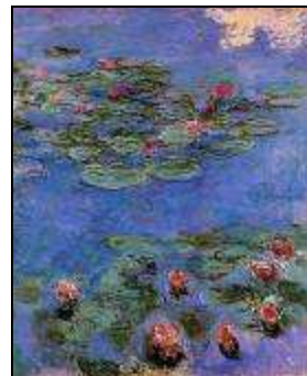
Claude Monet Nymphéas