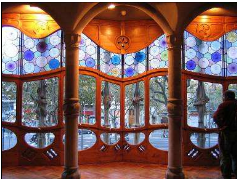
Casa Batlló Vue intérieure

Les formes de l'étage principal, semblent dignes de l'illustration Alphonse de Neuville de l'édition de 1870 du roman « Vingt mille lieues sous les mers » de Jules Verne.