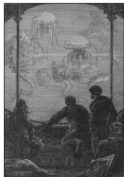
Illustration Alphonse de Neuville