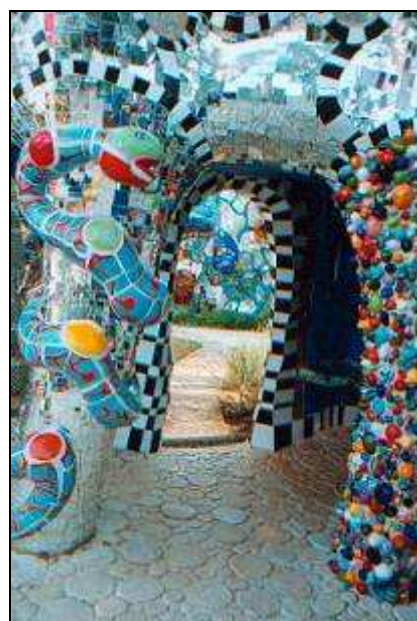
Niki de Saint Phalle Jardin des Tarots