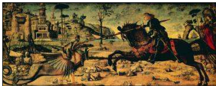
Vittore Carpaccio 1502