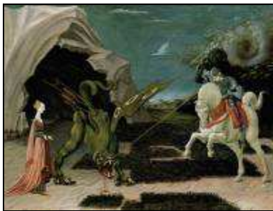
Paolo Uccello 1470

L'escalier en bois qui rappelle étrangement une colonne vertébrale, serait celle du dragon.