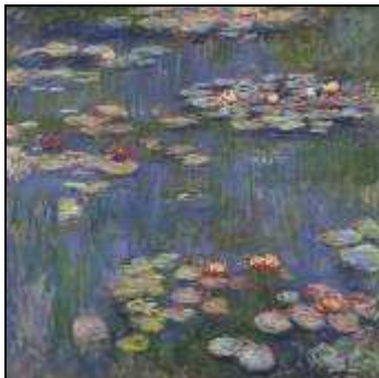
Claude Monet Nymphéas

D'autres perçoivent l'ondulation de ce tapis polychrome à dominance de verts et de bleus dans un sens aquatique (surfaces lacustres inspirée par les nymphéas de Monet). La façade ondulée, composée d'une mosaïque de verre et de céramique, donne sous l'effet du soleil l'impression d'onduler comme la surface d'un étang.