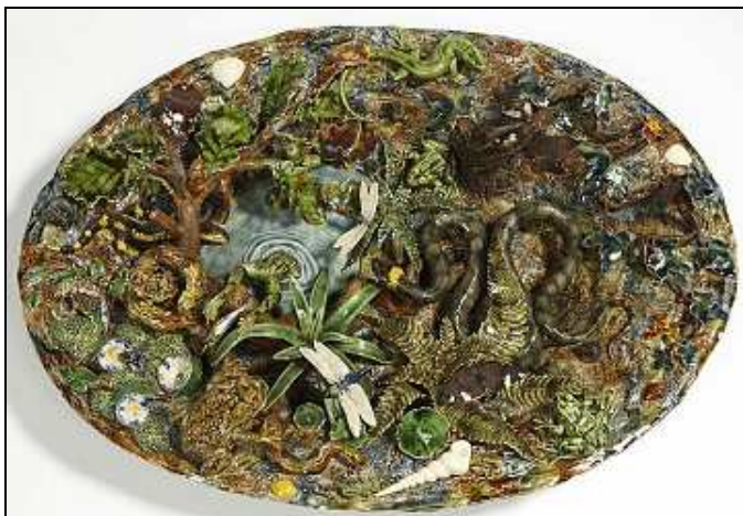
Joseph LANDAIS Plat à décoré