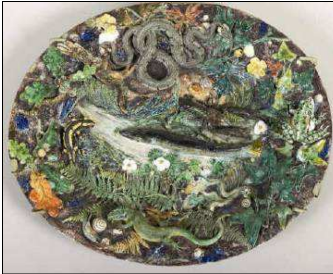
Charles-Jean AVISSEAU Grand plat ovale