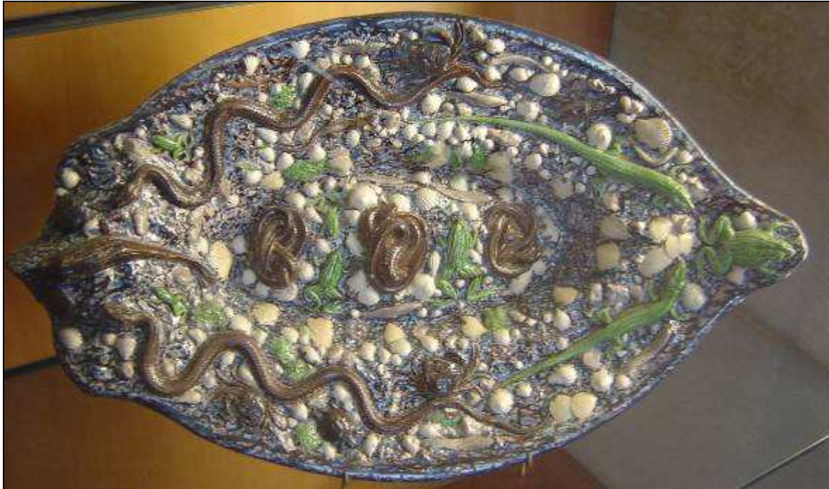
Bernard PALISSY Grand bassin rustique en forme de nacelle / Musée des Beaux arts / Lyon