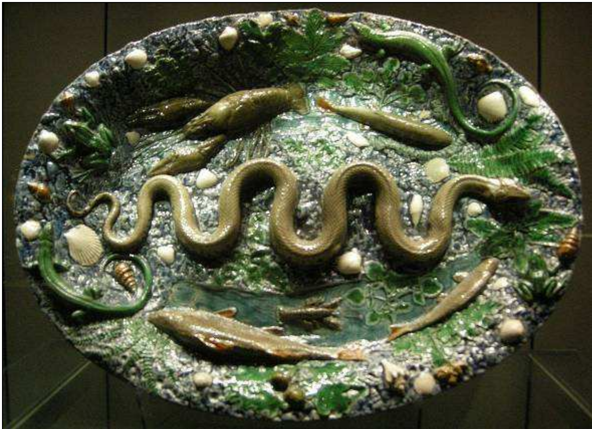
Bernard PALISSY (Attribué à) Bassin rustique / Musée du Louvre / Paris