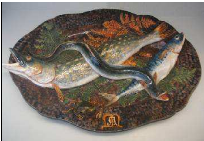
Auguste François CHAUVIGNE Plat de poissons