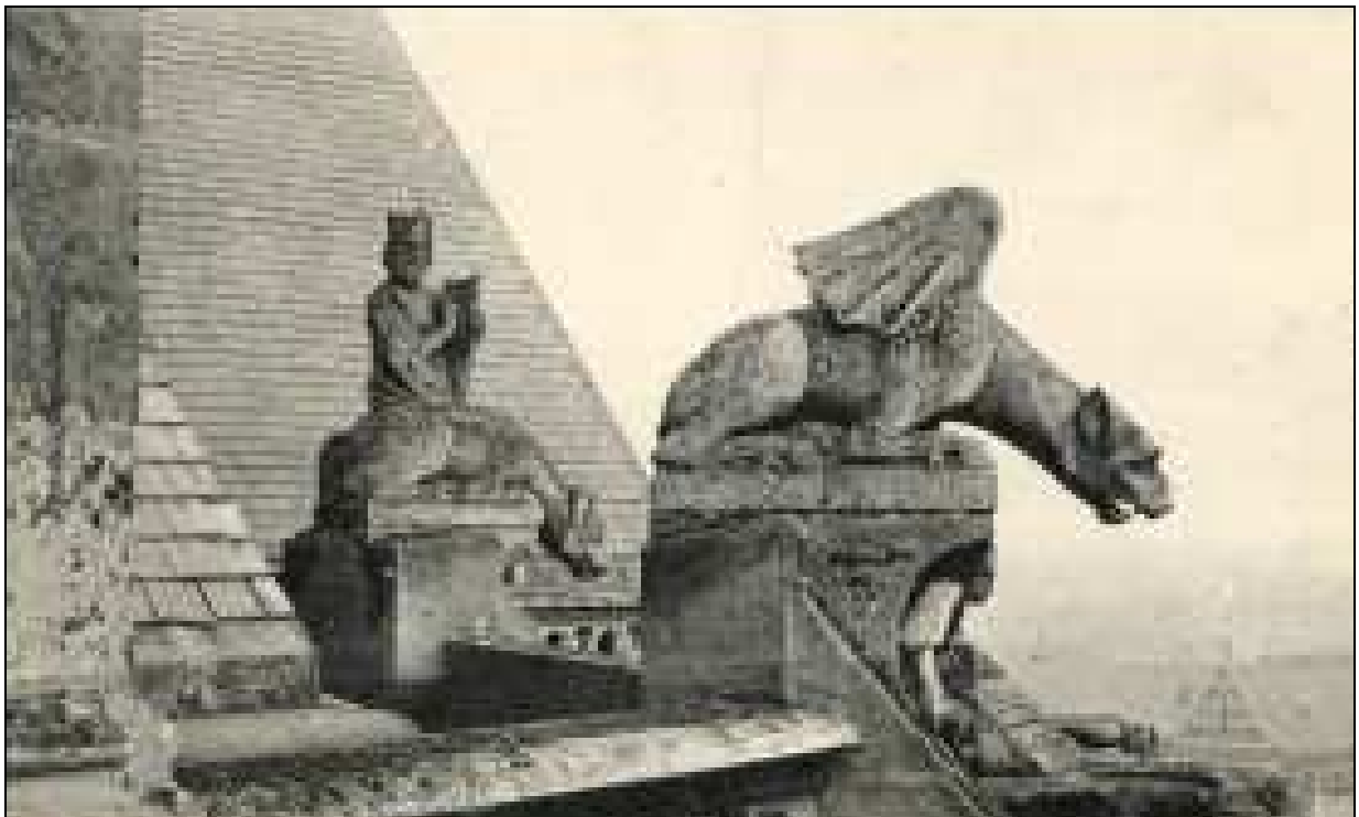
Chimère Cathédrale d'Amiens