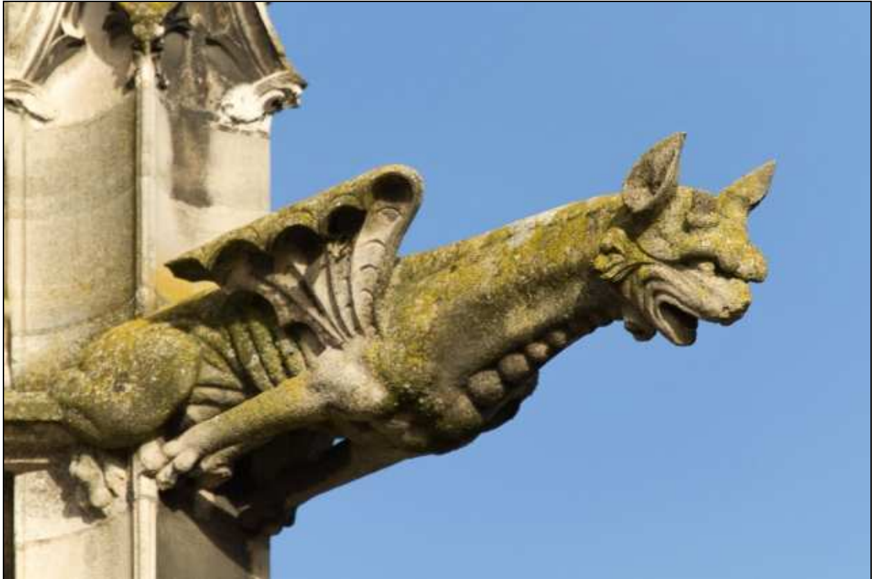
Gargouille Cathédrale d'Amiens