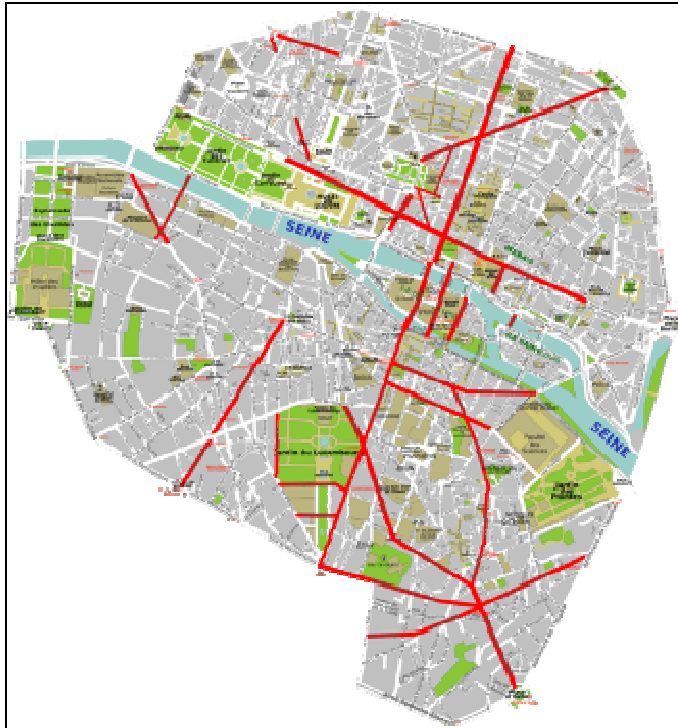
Les principaux axes créés ou transformés entre 1850 et 1870 dans le centre de Paris

Construction de théâtres (théâtre de la Ville et théâtre du Châtelet) et de gares (Gare de Lyon et Gare de l'Est).