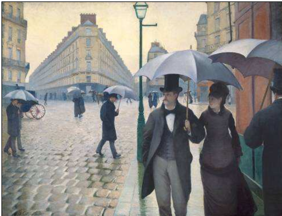
Gustave CAILLEBOTTE Rue de Paris, temps de pluie

Hausmann a su aussi propager son savoir-faire dans les différentes régions françaises : Rouen, Dijon, Angers, Bordeaux, Lille, Toulouse, Avignon, Montpellier, Toulon, Lyon, Nîmes et surtout Marseille.