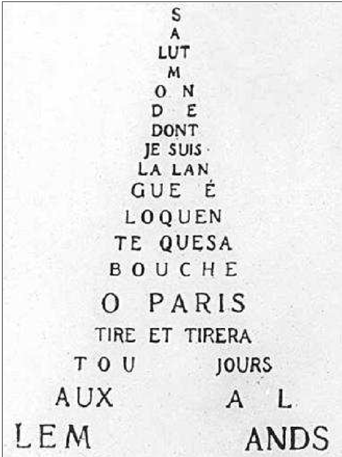
Calligramme de la Tour Eiffel de Guillaume Apollinaire