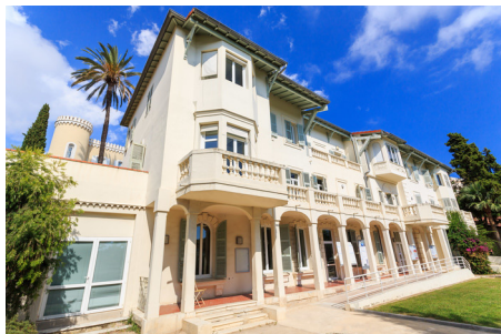
Cannes Château Font de Veyre