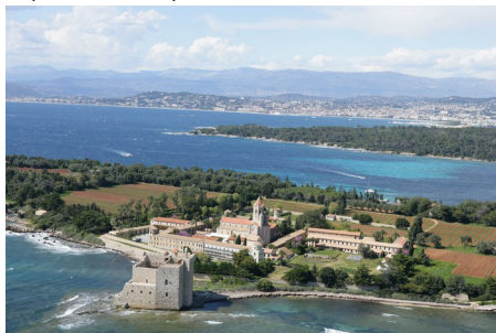
Cannes Abbaye de Lerins