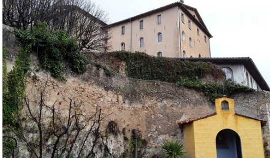
Grasse jardin visitation

Tél : 06 83 12 69 89 - http://www.chemindessens.com/installation/melusine-2018/melusine.html