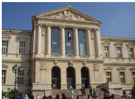
Nice Palais de justice