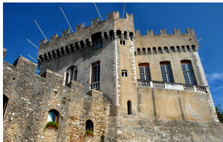
Cagnes Château Grimaldi