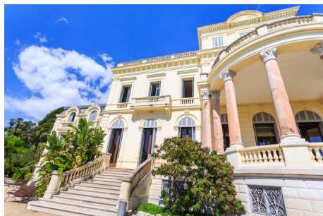
Cannes Médiathèque Noailles