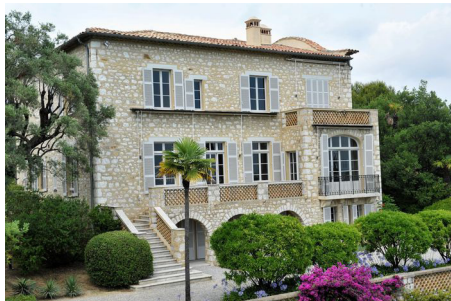
Musée Renoir

Tél : 04 93 20 61 07 - http://www.cagnes-sur-mer.fr/culture/musee-renoir/visite-et-mediation/