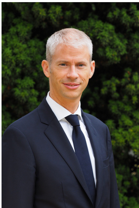
Franck Riester