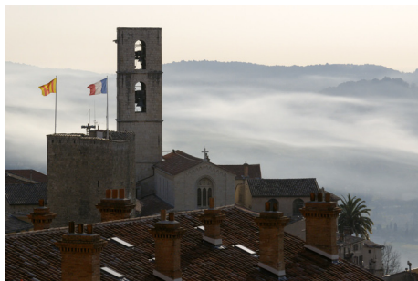
Grasse Cathédrale