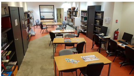
Antibes archives municipales © AM Antibes

Tél : 04 92 90 54 10 - http://archives.ville-antibes.fr