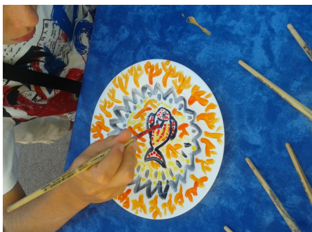
Vallauris decor assiette © Musée de la céramique