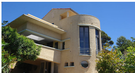
Cannes Villa Romée

Tél : 04 93 48 65 01 - http://www.architecture.com.fr