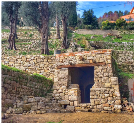
Grasse Bastide Isnard