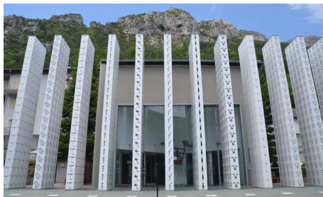
Tende Musée merveilles