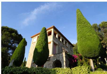
Cannes Villa Domergue