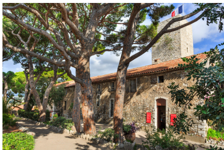
Cannes Musée de la Castre

Tél : 04 89 82 26 26 - http://www.cannes.com