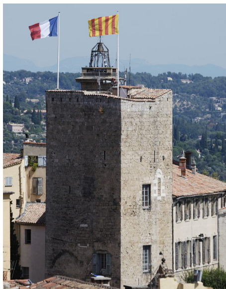
Grasse Tour évêché

Animations : Visite commentée. Dimanche 22/09 - 14h30 à 15h30. Tél : 04 97 05 58 70