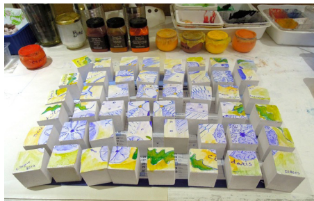
Antibes Galerie puzzles