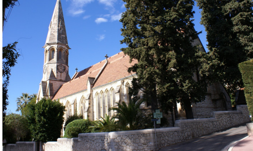
Cannes Eglise St-Georges

Tél : 04 93 99 04 04 - http://www.cannes.fr