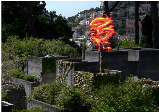
Nice Villa Arson

Tél : 04 92 07 73 73 - http://www.villa-arson.org