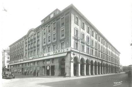
Nice galleries lafayette