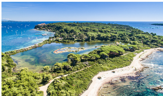
Cannes Sainte-Marguerite