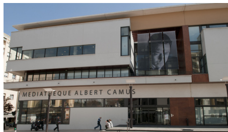
Antibes Médiathèque Albert Camus