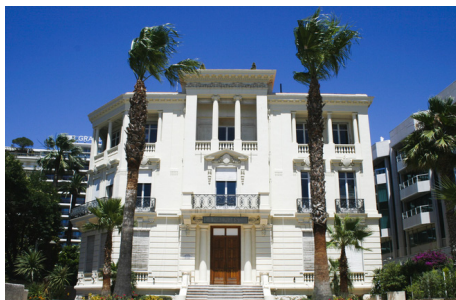
Cannes Malmaison

Tél : 04 97 06 45 21- http://www.cannes.com