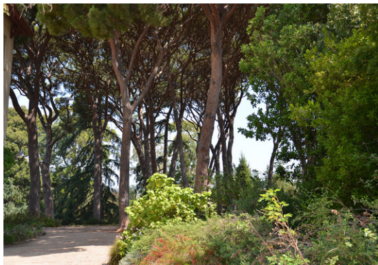
Antibes Thuret

http://www7.sophia.inra.fr/jardin_thuret