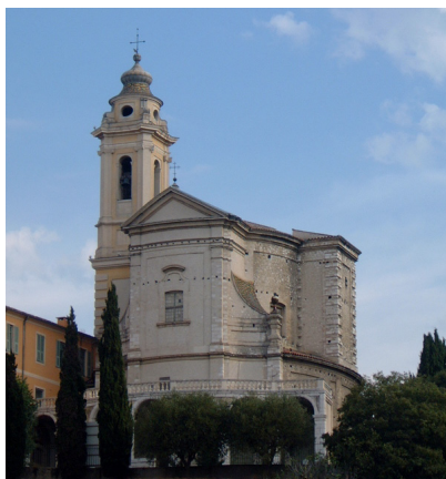
Nice église Saint-Pons