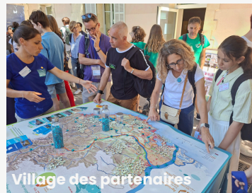
Village des partenaires