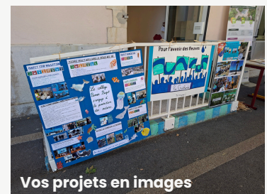
Vos projets en images