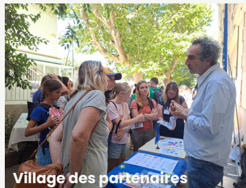
Village des partenaires