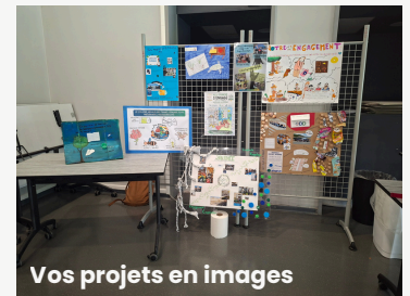
Vos projets en images