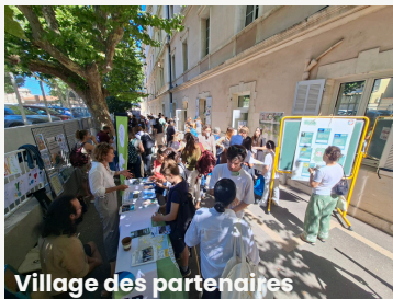
Village des partenaires