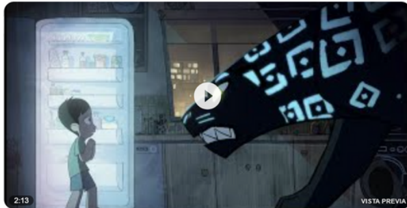
Greenpeace España, Hay un monstruo en mi cocina: la historia detrás de la deforestación , 2020