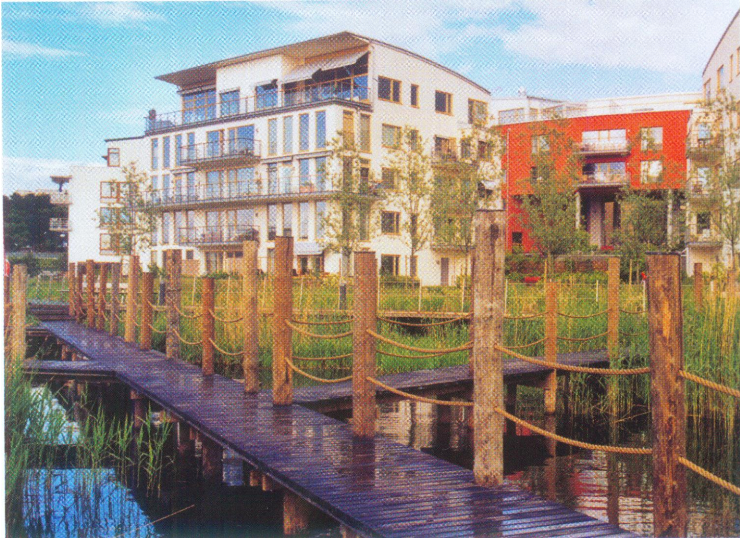
Malmö. Promenade dans la roselière qui permet de dépolluer le site ancien.