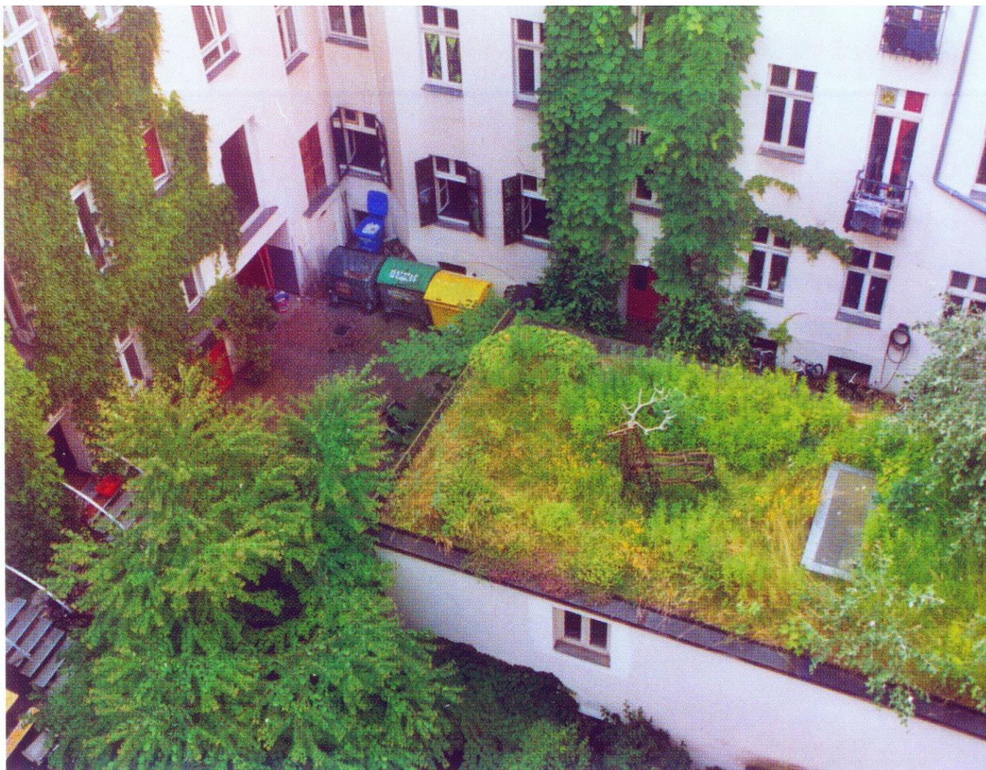
Kronsberg. Hanovre. Verdissement des îlots. Isolation thermique.