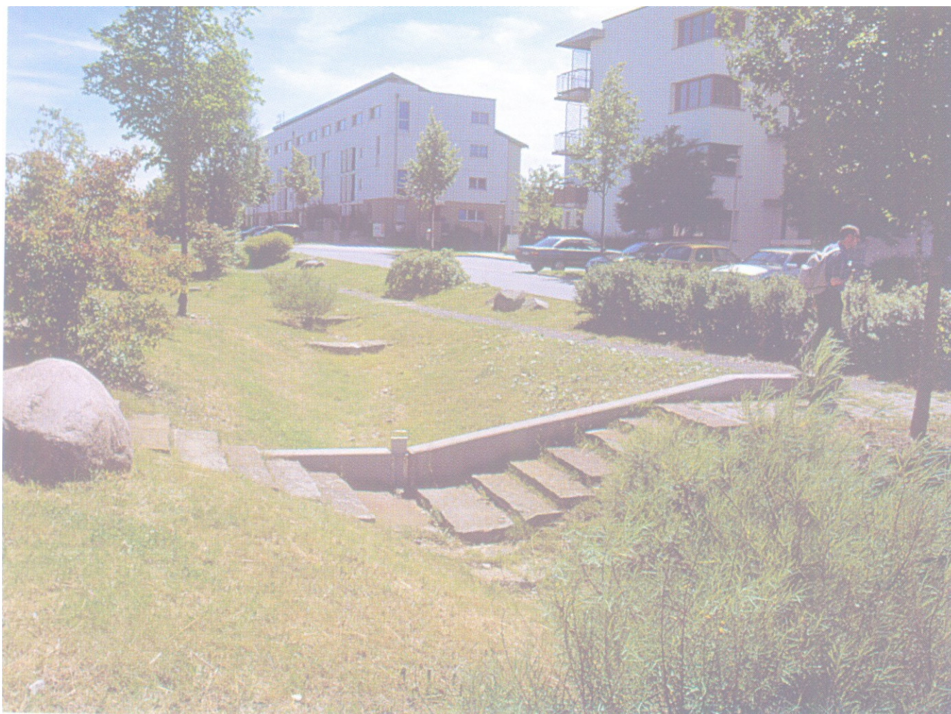
Kronsberg. Hanovre. Rétention, infiltration des eaux pluviales