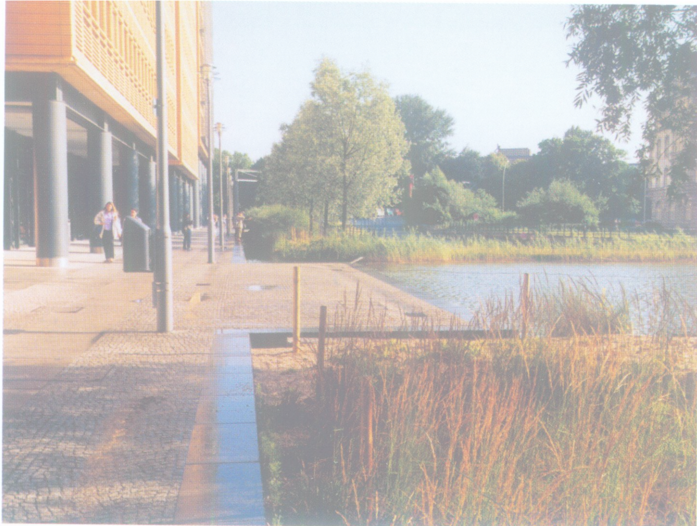
Postdam, Berlin. Un plan d'eau dans la ville.