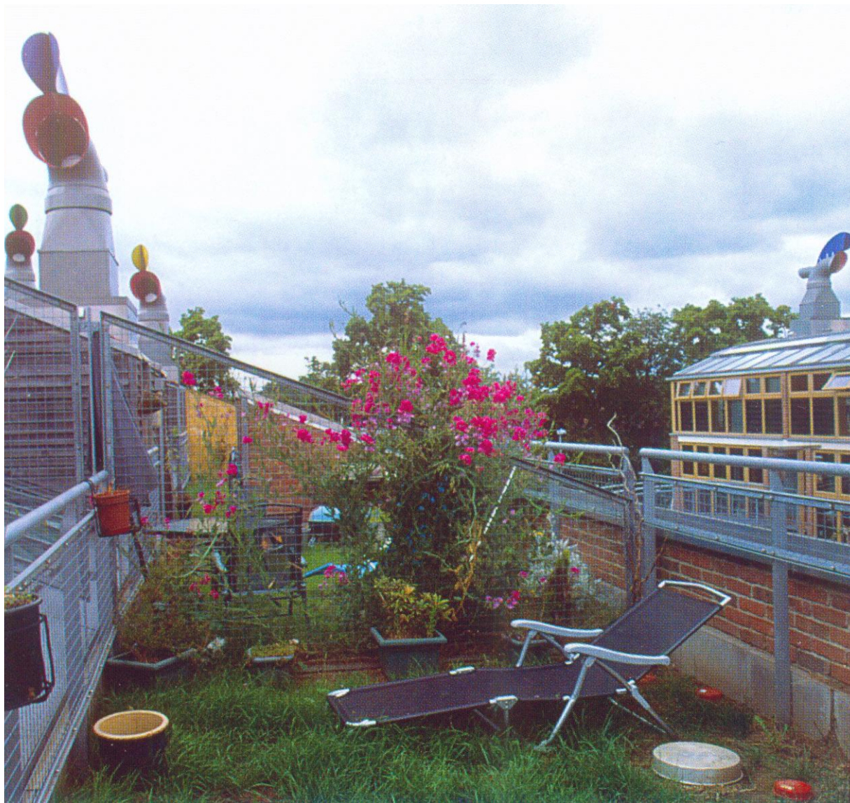
BedZed. Beddington. Jardins suspendus.