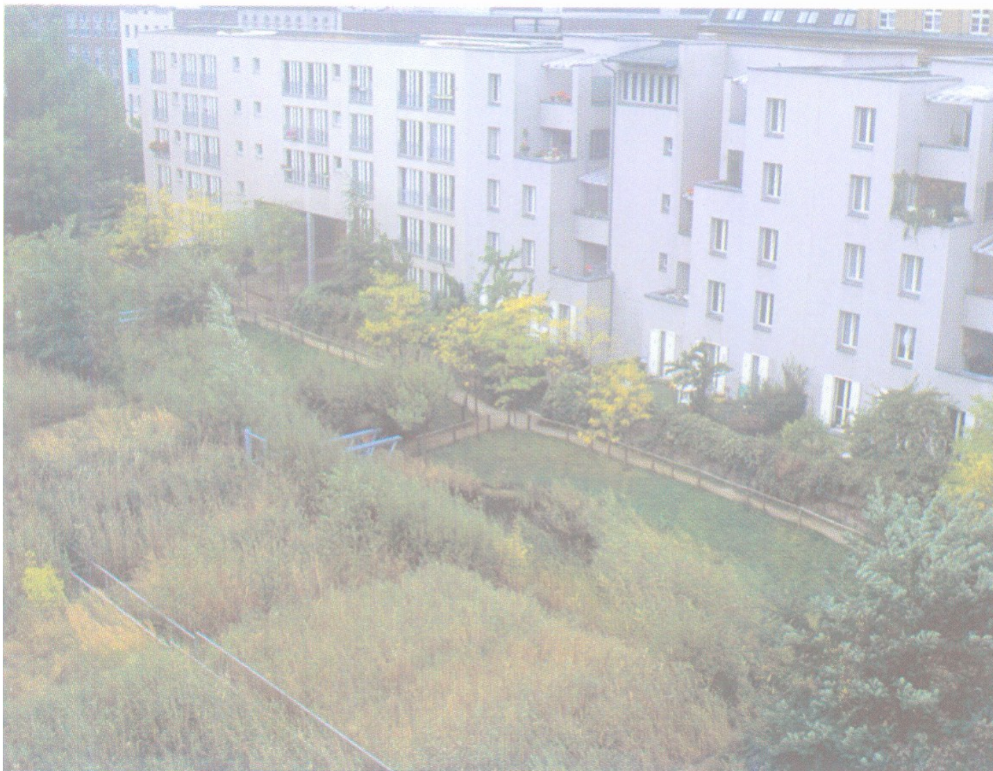
Postdam, Berlin. Station de traitement des eaux grises au milieu d'une douve de stockage des eaux pluviales