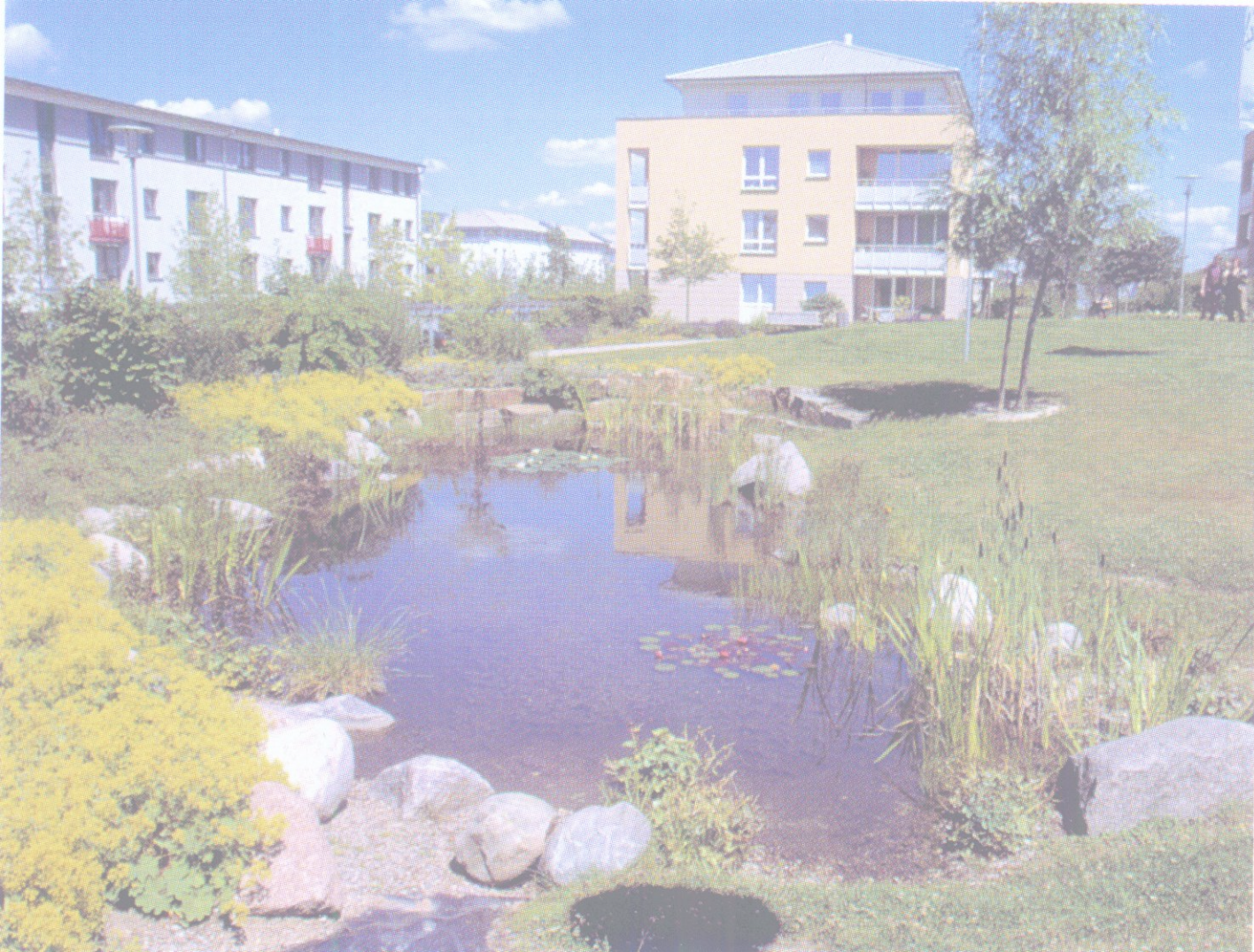
Kronsberg. Hanovre. Eaux de pluie entre les îlots bâtis