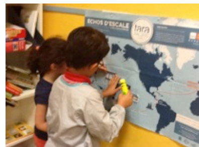
Retrouvez les ressources pédagogiques des 37 escales des missions de Tara et consultez votre propre parcours ? OUVREZ LA MALLE en cliquant sur l'un des trois boutons : Thématiques, Escales ou Expéditions. Téléchargez l'inventaire pdf de la malle ICI .

Nb : Les fiches ressources au fil des années ont été conçues par des enseignants pour des enseignants (dont l'académie de Rennes) coordonnées par un inspecteur pédagogique régional en charge de l'EDD.