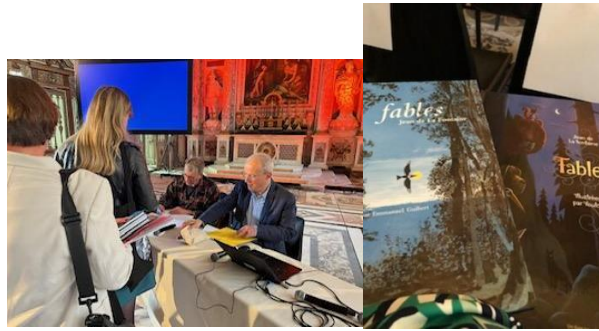
Table ronde : Les Fables de la Fontaine : un recueil à lire et à regarder

Une table ronde qui présente et fait dialoguer les démarches, les choix, les styles et illustrations des artistes dessinateurs, auteurs de bandes dessinées, commissionnés par le Ministère de Education Nationale de la Jeunesse et du Sport, pour illustrer les éditions annuelles des Fables de la Fontaine offertes à l'ensemble des élèves de CM2, chaque année depuis 2018, dans le cadre de l'opération Un livre pour les vacances.