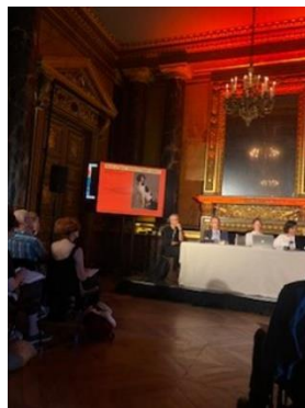
Table ronde - Penser et figurer l'animal à l'époque moderne

Les expositions « Les animaux du roi » (Versailles), « Le portrait animal aux XVII e et XVIII e siècles » (musée de la Chasse et de la Nature) et le colloque « Portrait et animal à la Renaissance », montrent que les représentations artistiques et intellectuelles des animaux sont en mutation. Ces créations éclairent les diverses perceptions de l'animal jusqu'aux travaux du premier éthologiste, Ch.-G. Leroy (1723-1789), chasseur-philosophe promoteur des intelligences et sensibilités animales. Penser les animaux figurés appelle à croiser histoire de l'art, anthropologie, éthologie et philosophie.