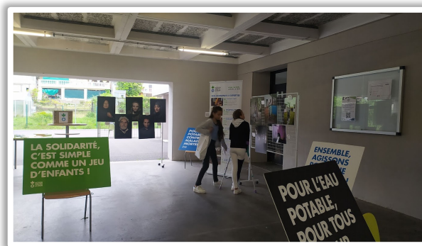
Sensibilizzazione degli alunni alla fame nel mondo