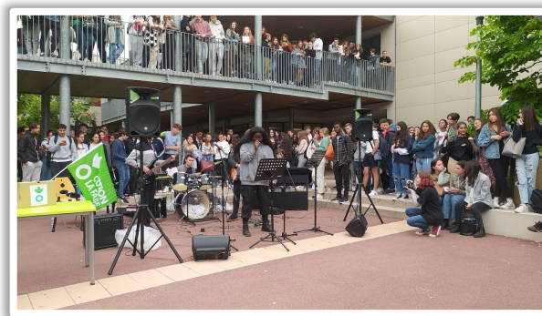
Concerto per Azione contro la Fame

Abbiamo visto delle persone disperate che hanno bisogno d'aiuto e che sono vittime di condizioni molto difficili. Abbiamo studiato le migrazioni, e soprattutto le cause dell'emigrazione o dell'immigrazione. Vediamo che sono spesso delle persone che partono a causa della guerra, della fame, di condizioni climatiche estreme o di condizioni di vita molto difficili. Di più, queste persone non ricevono alcuni aiuto dallo stato o da altre persone. In questi casi, delle associazioni possono aiutarle, dando loro una mano o delle risorse. Dunque, Azione contro la Fame, un'associazione non governativa, aiuta le persone che hanno fame attraverso più di 50 paesi. Creano dei progetti diversi per milioni di persone che soffrono della fame. Per esempio, costruiscono dighe o pozzi per lottare contro le condizioni climatiche o sanitarie difficili, distribuiscono risorse, o propongono delle formazioni per insegnare alla gente un mestiere per avere soldi. Insomma, quest'associazione aiuta le persone che hanno fame e contribuisce a farle stare nel loro paese. Siamo tutti umani, dunque dobbiamo aiutare le persone nel bisogno. Secondo me, meritano il nostro aiuto.