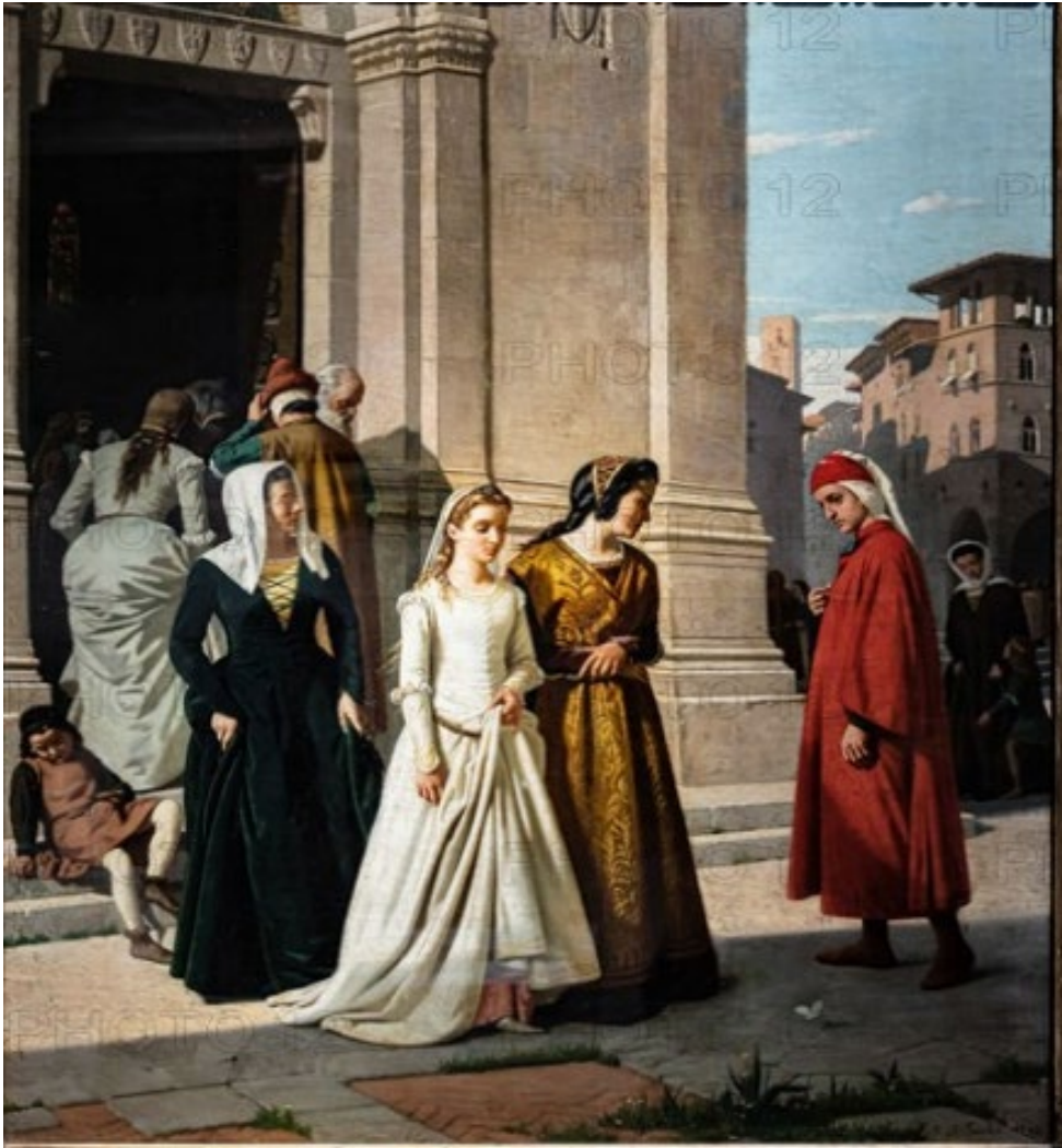
Raffaello SORBI, Dante che incontra Beatrice , 1863.