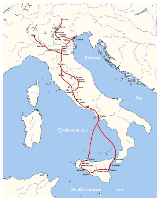
L'itinerario di Goethe durante il viaggio in Italia da lui intrapreso tra il 1786 e il 1788.

Oltre all'Italia, il Grand Tour toccava molte città del continente europeo come, ad esempio, Parigi (spesso prima tappa) , Ginevra, Vienna, Costantinopoli, Dresda, Atene (particolarmente apprezzata da Byron) e Londra, da cui spesso partiva e terminava il tour.