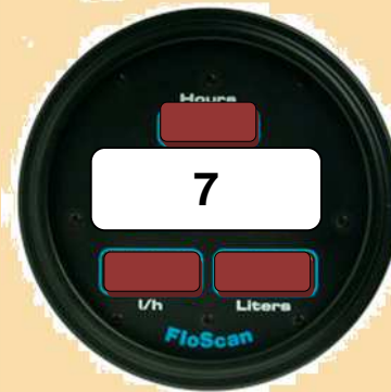
Indicateur de consommation en L/s (pour 1 s)