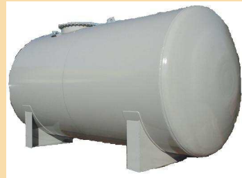
Forme du réservoir : cylindrique Volume du réservoir : 4233,6 \text{ m}^3