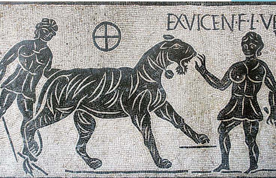
Un tigre vaincu par deux gladiateurs.

Le gladiateur esclave le plus célèbre est Spartacus. Berger thrace (ancien peuple de la péninsule balkanique) vivant au I er siècle avant J.C, qui a été vendu comme esclave. Il s'évade d'une école de gladiateurs de Capoue, ville romaine et devient le chef des esclaves révoltés contre Rome.