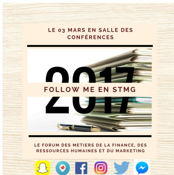
Affiche du forum (distribuée au sein du lycée)