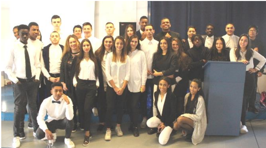
Les organisateurs du Projet (Classe de 1 ère STMG1)

Pour la 4ème année consécutive, le Lycée Thierry Maulnier a organisé, le vendredi 3 mars 2017, « FOLLOW ME EN STMG », le forum des métiers du commerce, des ressources humaines et de la finance.